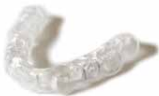
Eine Aufbissschiene entlastet.